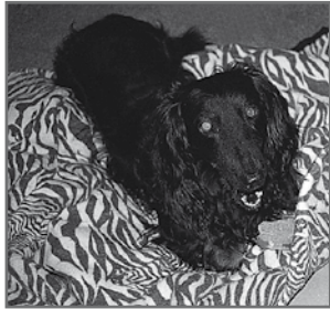
Yankee verteidigt seine Wassermatratze, nachdem sie ihm das Leben rettete, die alte Schmusedecke hat ausgedient.

Zerbrochene Hundehüfte heilt schnell und rückstandslos auf einer TASSO-Wassermatratze!